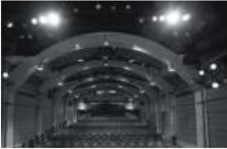
Théâtre du Vieux-Colombier