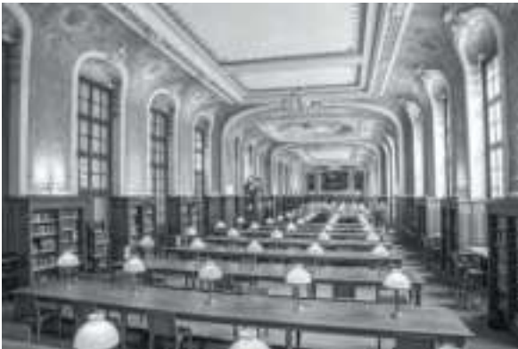
Bibliothèque de la Sorbonne